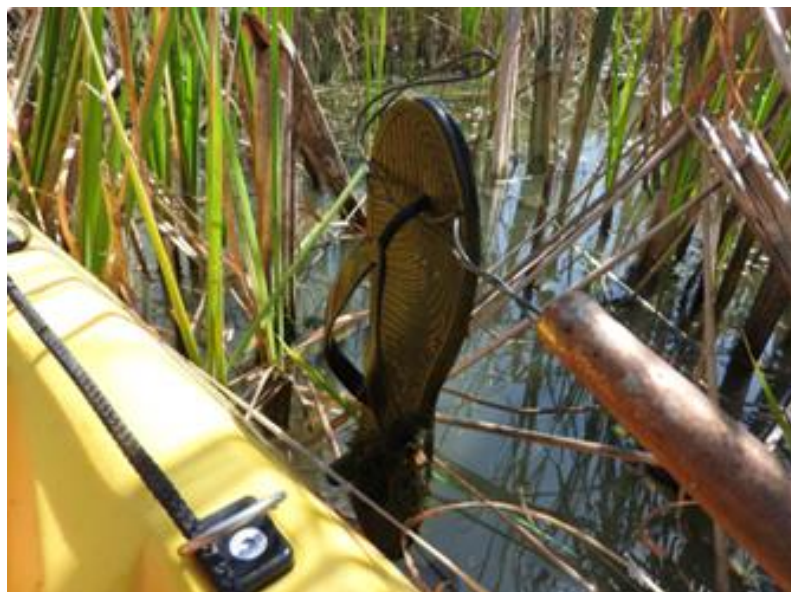
Еко-акция около защитена местност „Устието на река Изворска”, област Бургас